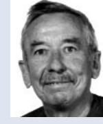
Édouard Kauffmann Heiderscheider Grund, Luxembourg

Le comité consultatif européen des actionnaires individuels de Dexia a tenu sa première réunion à Bruxelles le 16 octobre 2001.